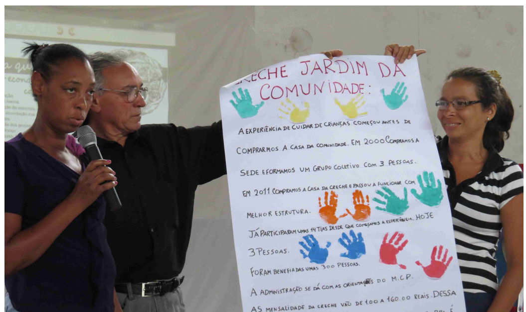
Creche Jardim da Comunidade